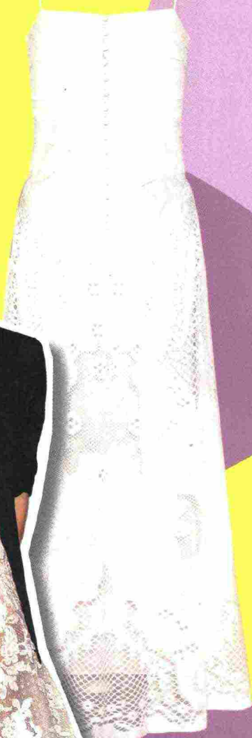
Abito lungo in pizzo di cotone ( Beatrice .b. , 395 euro).