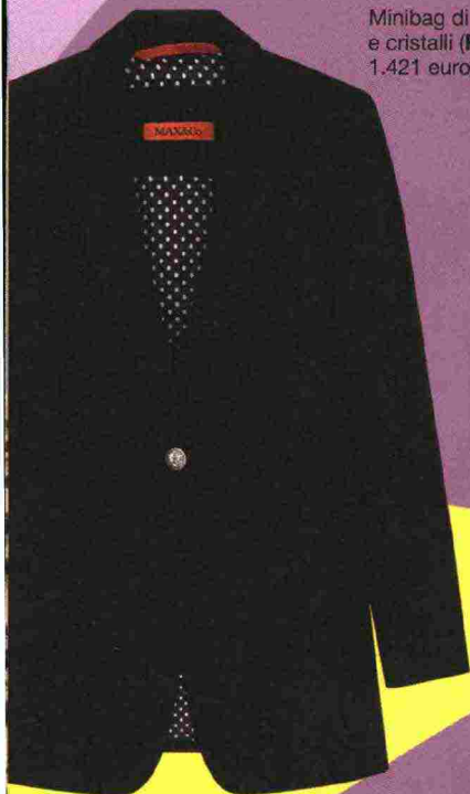
Blazer di tela bistretch sostenibile ( Max&Co. , 259 euro).