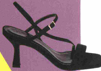
Sandali di Lycra ( Primadonna Collection , 59,99 euro)